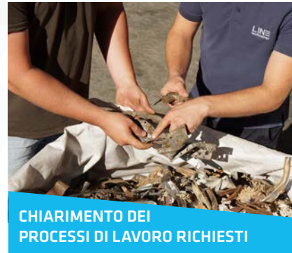
1. CHIARIMENTO DEI PROCESSI DI LAVORO RICHIESTI