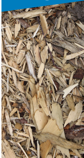
Scarti di legno