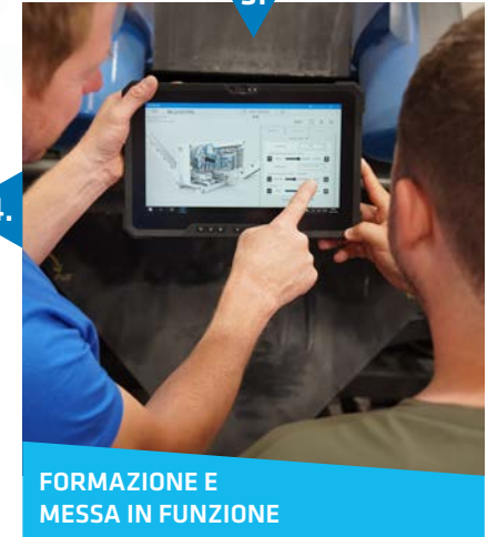
3. FORMAZIONE E MESSA IN FUNZIONE