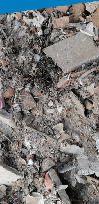
Detriti di costruzione