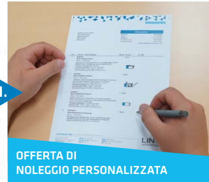
2. OFFERTA DI NOLEGGIO PERSONALIZZATA