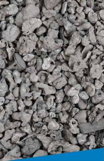
Scorie e ceneri