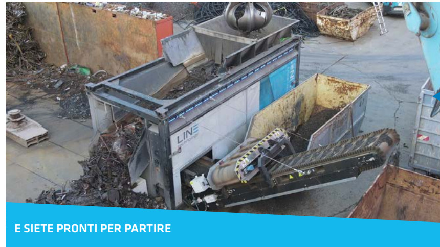
4. E SIETE PRONTI PER PARTIRE