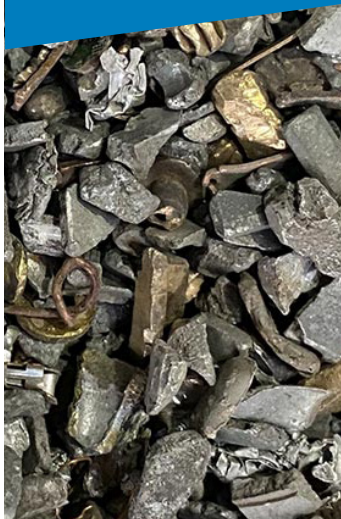
Metalli non ferrosi