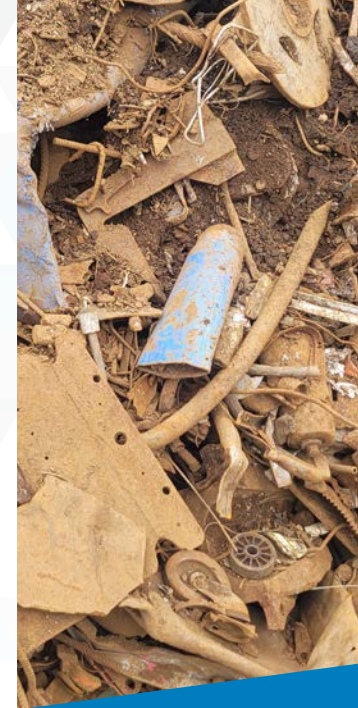
Polveri abrasive/ rifiuti

CON BLUELINE È POSSIBILE TRATTARE IN MODO ECONOMICAMENTE CONVENIENTE UN'AMPIA VARIETÀ DI MATERIALI, ANCHE IN PICCOLE QUANTITÀ